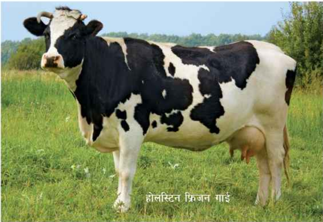
होलस्टिन फ्रिजन गाई