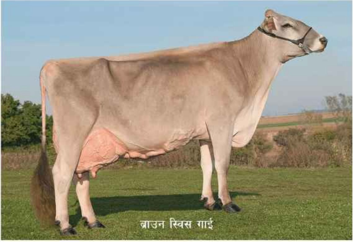
ब्राउन स्विस गार्ड